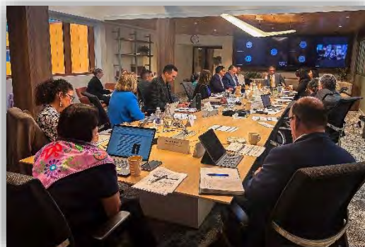
Réunion du CNDÉA avec des membres du Conseil de la Nation Crie et de la Société de développement crie au bureau de la Nation Crie à Montréal

La Nation crie a fait part de ses préoccupations concernant le projet de loi Q-5 du Québec, qui, selon elle, ne reflète pas les réalités autochtones et pourrait restreindre l'accès à d'importantes industries. Elle a également fait le point sur leur processus d'évaluation environnementale, qui est guidé par les échéances communautaires.