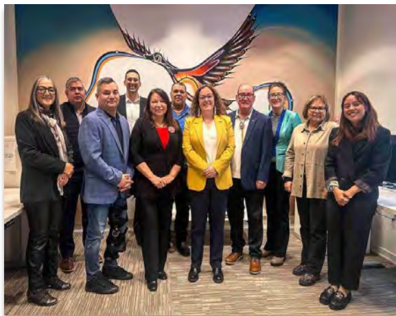
Les membres du CNDÉA avec Rebecca Alty, ministre des Relations Couronne-Autochtones